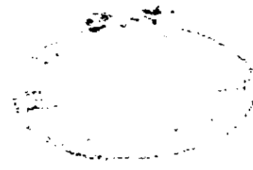
صورة الصفحة الاخيرة من المخطوطة