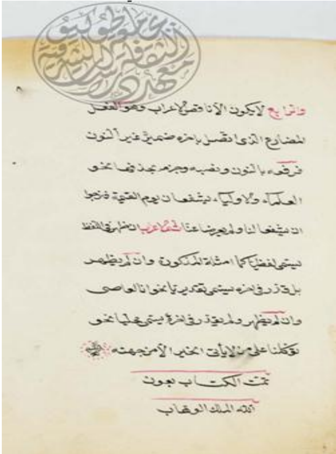
الصفحة الأخيرة من نسخة ( ب )